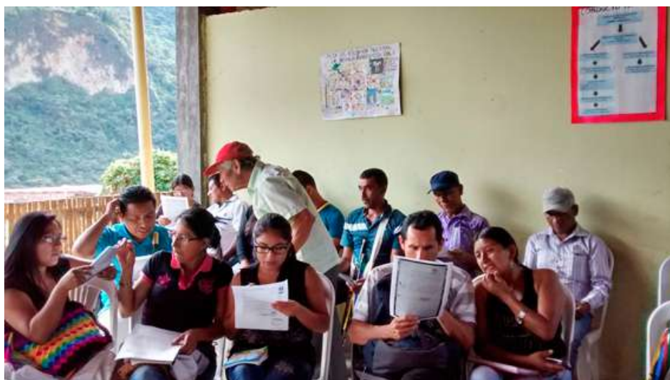
Fotografías 2 y 3. Capacitación en Posibles Usos de los Documentos Históricos. Cabildo Indígena de Belalcázar, Páez, Cauca. 18 de agosto de 2017.

A la fecha el AGN ha culminado su intervención en los Planes Integrales de Reparación Colectiva del Consejo Comunitario Los Cardonales de Guacoche y del Proyecto Nasa (que también comprende los resguardos nasas de Toribío, Tacueyó y San Francisco). En este momento el AGN continúa su participación en los Planes Integrales de Reparación Colectiva de los resguardos de Pitayó, Kisgó y Kitek Kiwe.