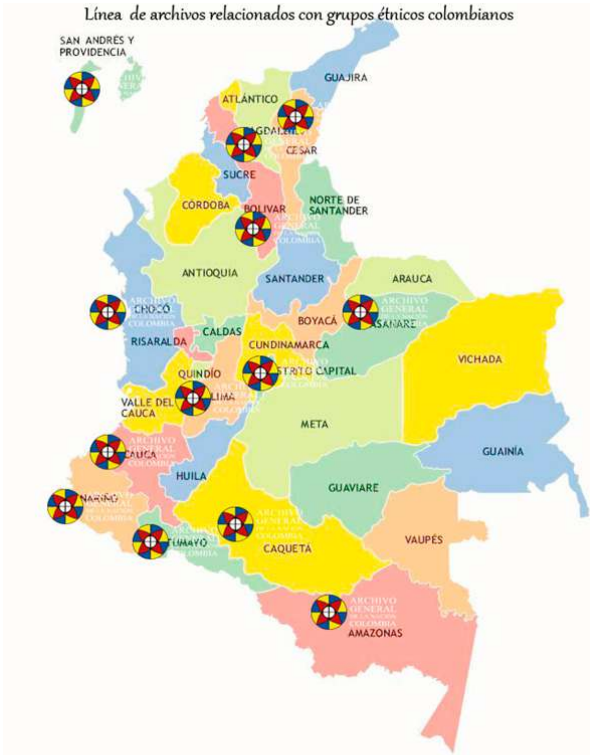
Mapa 1. Lugares en los que el AGN ha desarrollado acciones relativas a la conformación, protección y conservación de archivos relacionados con grupos étnicos.