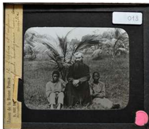
Fotografía 13. 12 L'Eglise et l'enfance. Enfants indigènes avec leur maître.

Por su parte, la Beca de gestión de archivos sonoros de Colombia busca apoyar la preservación, conservación y circulación de colecciones sonoras nacionales, privadas o institucionales, de sonido inédito o editado, que por la vulnerabilidad de sus soportes originales (cintas magnéticas, discos de vinilo, cilindros de cera, etc.) o por el fallecimiento de sus propietarios, tenedores o custodios, se encuentren en riesgo de desaparecer. Esta beca inició en el 2015 y hasta el 2018 se han apoyado siete proyectos de colecciones sonoras con contenido de gran importancia para la historia de Colombia, los cuales podrán ser consultados muy pronto a través del portal web del Archivo General de la Nación.