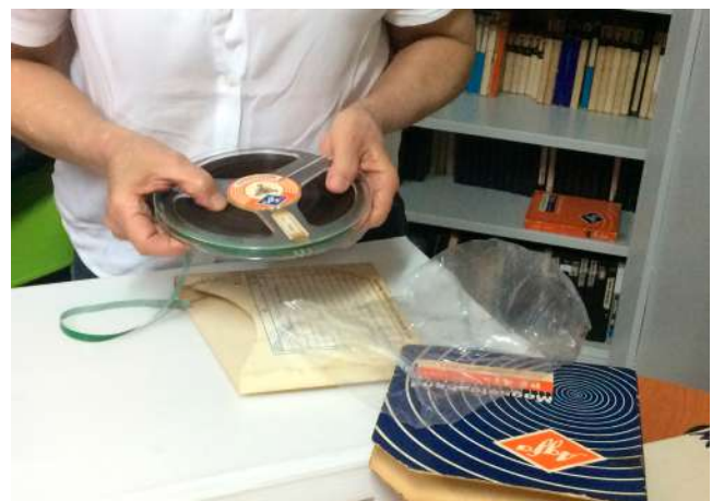
Fotografía 1. Visita de Asistencia Técnica AGN al Instituto Popular de Cultura Cali - Valle del Cauca 2018.

Bajo estas premisas, el Archivo General de la Nación, en cumplimiento de sus funciones, ha venido adelantando procesos de interlocución con algunas comunidades pertenecientes a grupos étnicos, encaminados a configurar escenarios para promover y acompañar la conformación, conservación y protección de sus propios archivos. Con ello el AGN pretende aportar a estas comunidades los elementos que, desde sus particulares necesidades e intereses, consideren relevantes y útiles para sus procesos de consolidación étnica y cultural, proporcionando herramientas básicas para un adecuado manejo de su documentación, especialmente aquella relacionada con la conservación de su cultura, su memoria y la defensa de sus derechos.