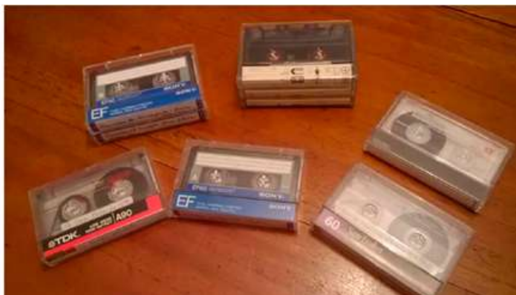
Fotografías 14 y 15. Colección sonora Juan de la Cruz Varela y la provincia del Sumapaz. Rocío Londoño botero