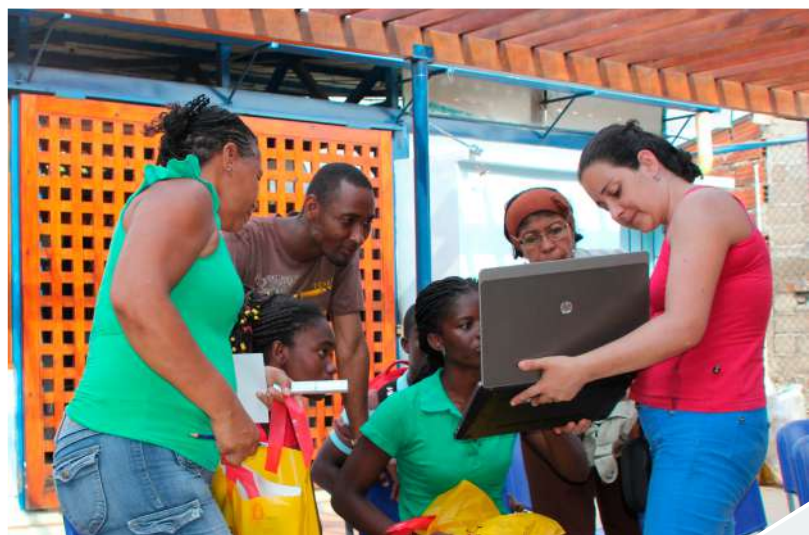
Fotografía 4. Capacitación en Conceptos Básicos de Archivos. San Basilio de Palenque 2014.

La política será publicada en la vigencia 2019 y se programarán socializaciones y recolección de observaciones por parte de las organizaciones y de las comunidades relacionadas con los grupos étnicos colombianos.