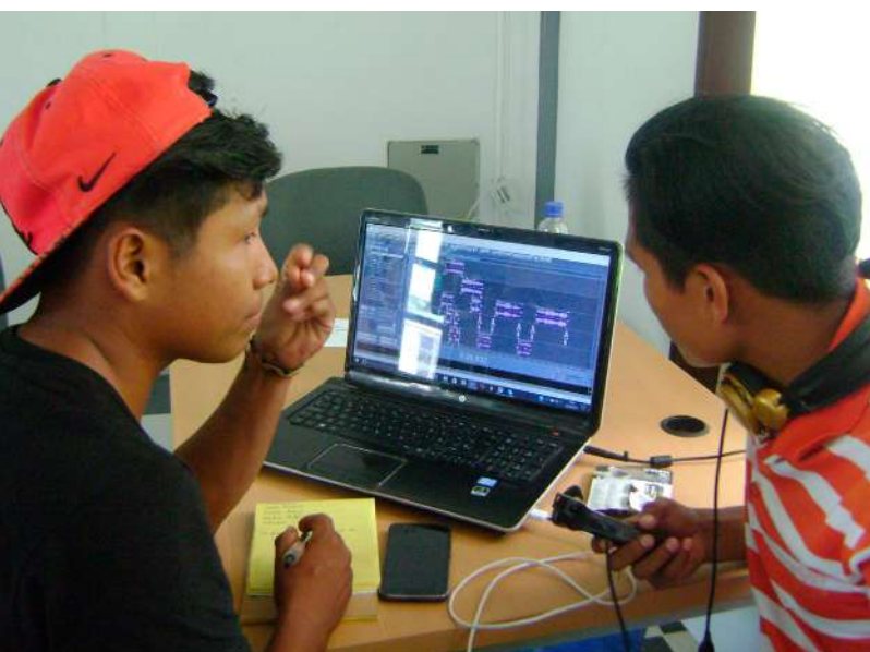
Fotografía 11. Encuentro de Formación en Comunicación Propia y Apropiada para Jóvenes Comunicadores indígenas, Leticia - Amazonas 16 de Junio de 2017.

De esta manera, los acervos fotográficos,